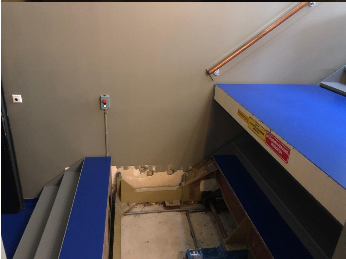
Laatste drie treden via ramp